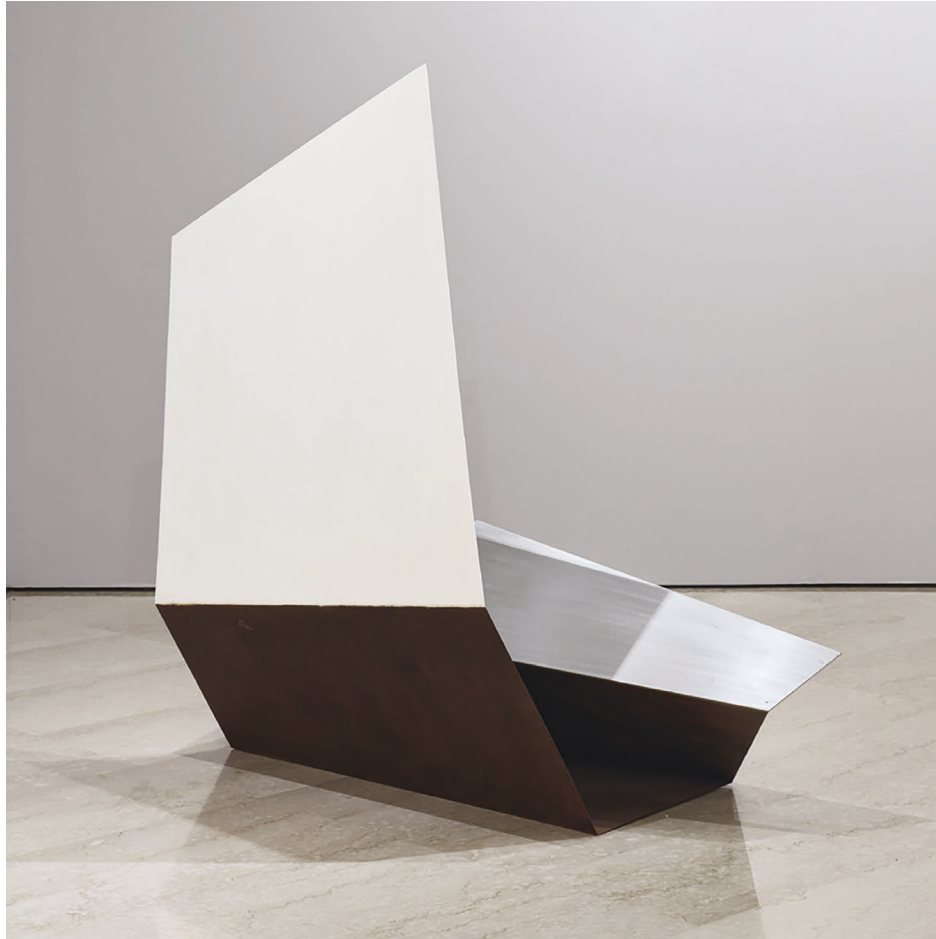
“ Germinazione n° 7 ”, 1990

2024 Bologna, CUBO in Torre Unipol e in Porta Europa, “ Eccentriche Nature ”, a cura di Pasquale Fameli con la collaborazione di Valentina Rossi.