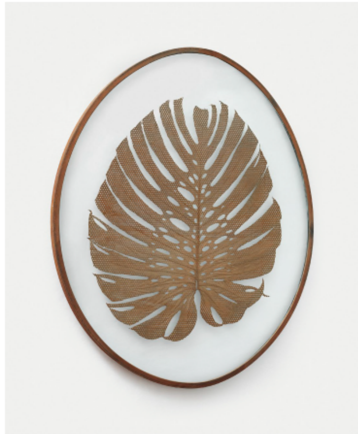
"Architettura ovale", 1996