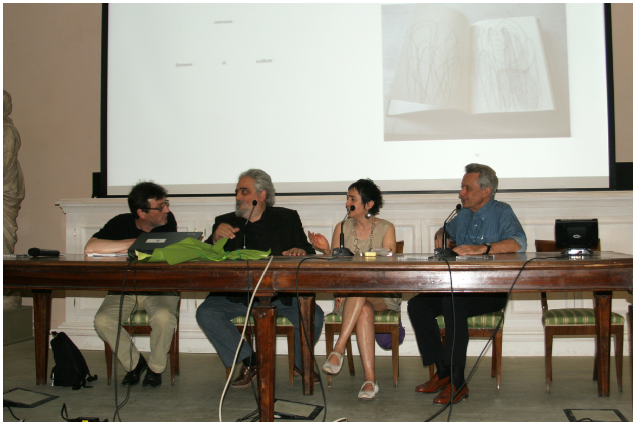
Presentazione libro " da 1 a 10 ", Aula Magna - Accademia Belle Arti Bologna